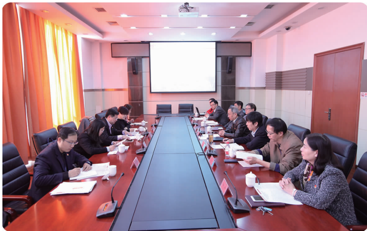
上图 9月28日,学校举行“喜迎十九大,唱响幸福歌”老教师文艺汇演