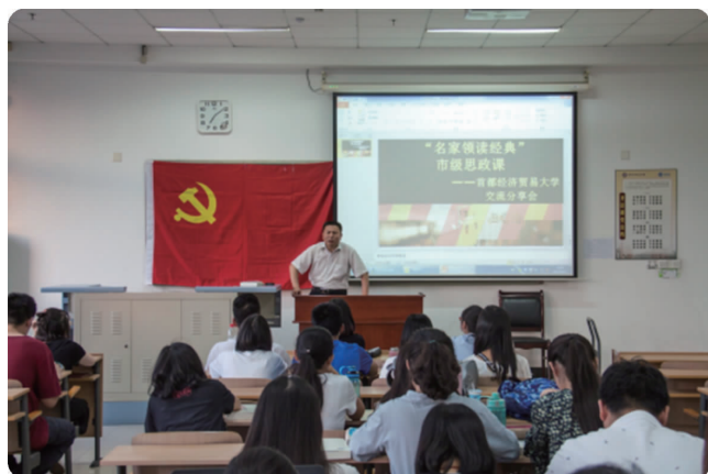
上图 12月20日,华侨学院举行第十二届华侨学院优秀学生表彰大会