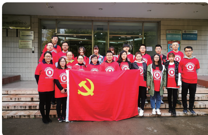
中图 11月14—15日,信息学院开展维护信息安全稳定志愿活动,图为志愿者在校本部开展活动后合影