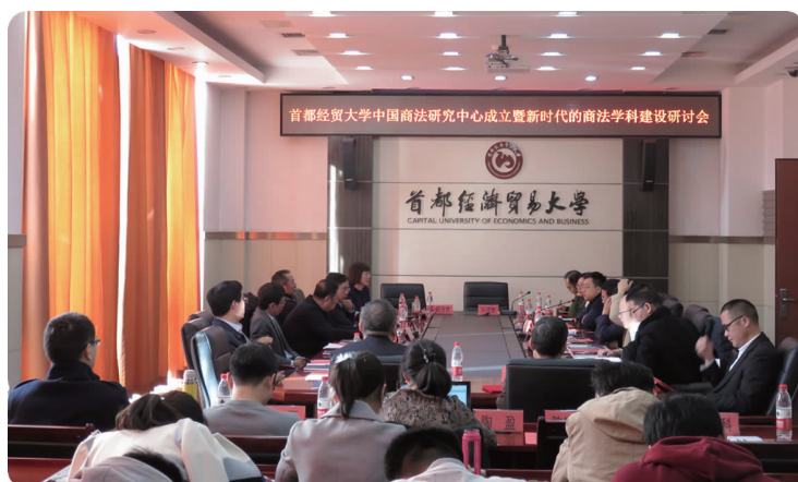
中图 11月10日,学校法学院举行中国商法研究中心成立暨新时代的商法学科建设研讨会