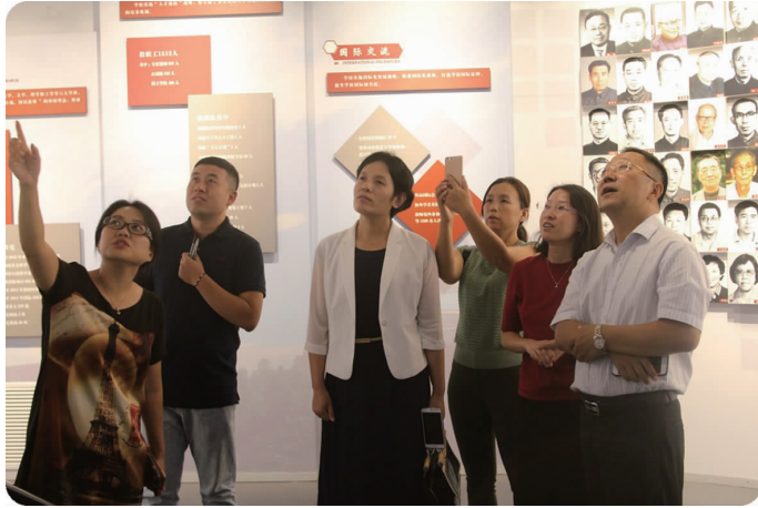
上图 9月4日,北京石油化工学院代表参观、调研学校校史馆建设