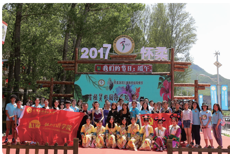
中图 5月28日,外国语学院组织学生党员开展怀柔汤河川满族民俗风情节暨首经贸外国语学院传统文化展演活动