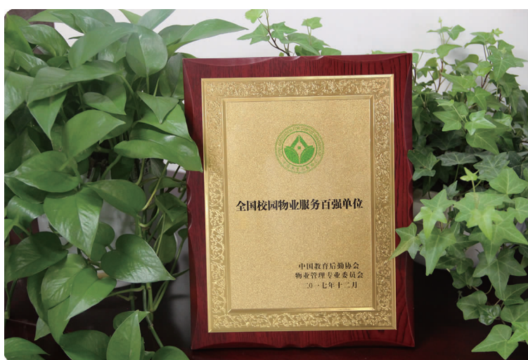
下图 2017年,经贸崇诚物业管理有限公司获“2016年度全国校园物业服务百强单位”称号