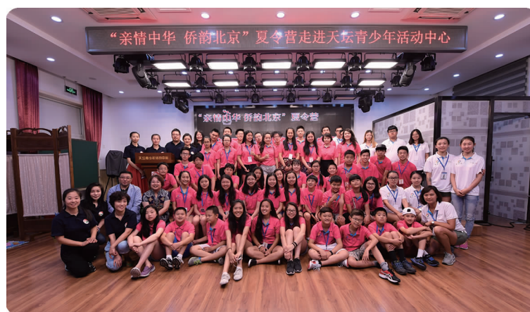
下图 7月,华侨学院学生(右侧着白衣及蓝色标牌者)为“亲情中华夏令营”提供志愿服务