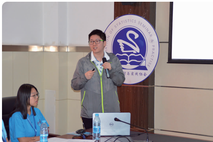
下图 5月19日,统计学院拉拉操队获信息第十一届拉拉操比赛冠军,实现三连冠