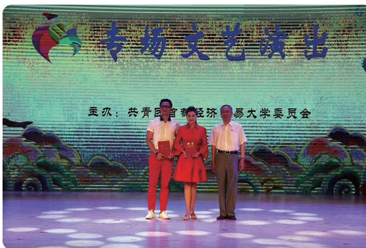
下图 9月7日,学校老教育工作者 协会举行第五届会员代表大会