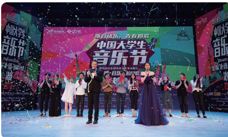
下图 5月4日,学校举行第十四届“唯音成乐,青春如歌”校园歌手大赛