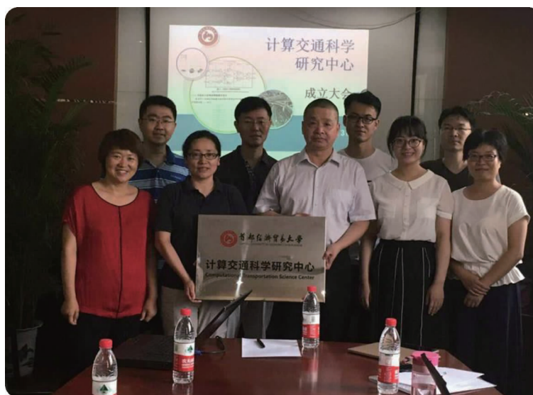
上图 7月3日,信息学院成立计算交通科学研究中心