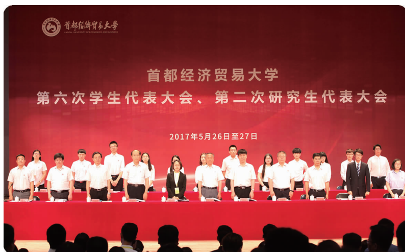
上图 5月26日,学校召开第六次 学生代表大会、第二次研究生 代表大会