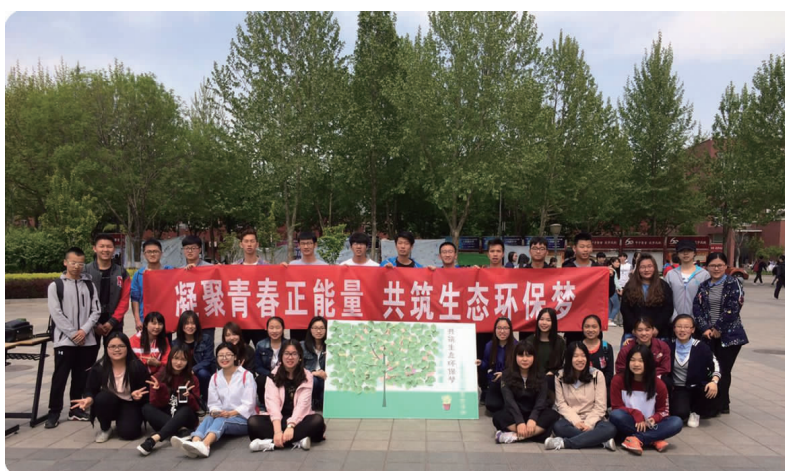
下图 4月20日,工商管理学院举办“凝聚青春正能量 共筑生态环保梦”绿植发放活动