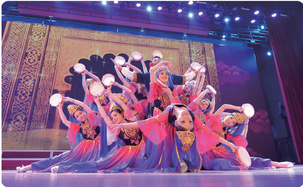
下图 12月21日,学校举行2018新年文艺演出