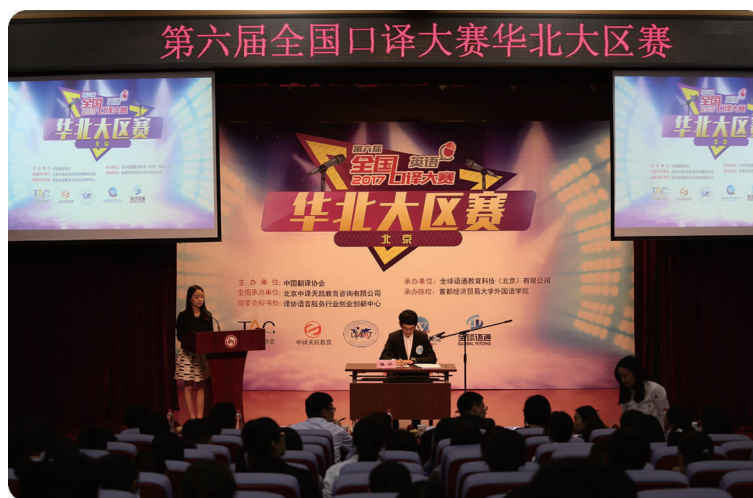
上图 5月13日,外国语学院承办第六届全国口译大赛华北大区赛