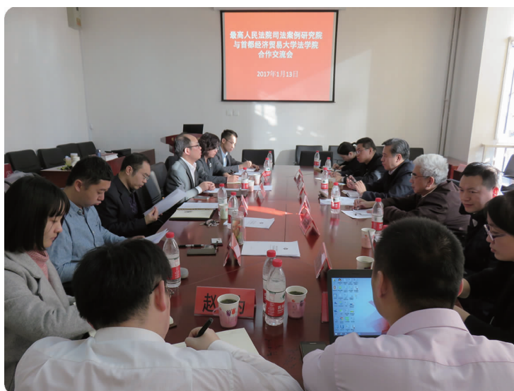
上图 1月13日,法学院举行最高人民法院案例研究院合作交流会