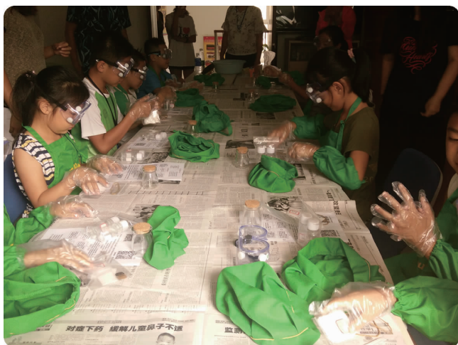
上图 8月15日,安全与环境工程学院开展红色“1+1”共建活动“科普实验进社区”,图为志愿者指导社区小学生做实验准备