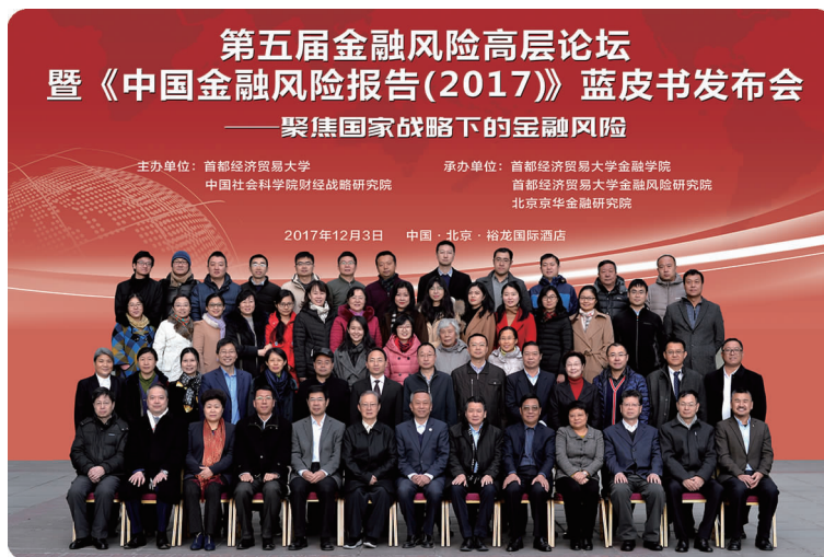
上图 12月3日,金融学院举办第五届金融风险高层论坛暨《中国金融风险报告(2017)》蓝皮书发布会