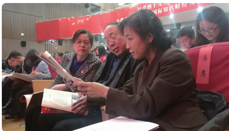
上图 2017年,学校档案馆编纂《党代会史话》,图为党代表在学校第四次党员代表大会上翻阅《党代会史话》