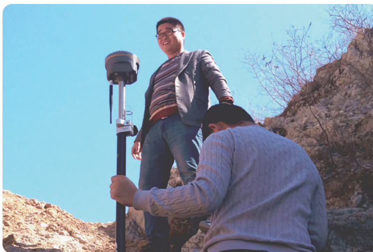
上图 3月,城市经济与公共管理学院师生进行测绘实践教学