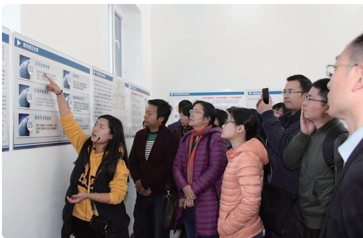
下图 11月3日,金融学院党委到雄安新区调研考察