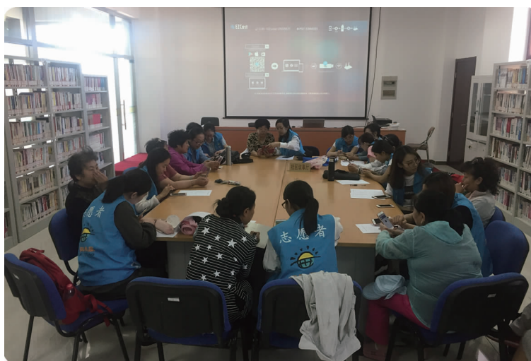
下图 5月13日,安全与环境工程学院志愿者开展“夕阳再晨”科技助老活动,图为志愿者帮助社区老人学习智能手机使用