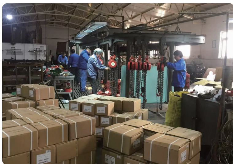
中图 2017年,北京起重工具厂生产销售手拉葫芦销售额同比增长229%,图为生产车间工人正在紧锣密鼓地组装产品