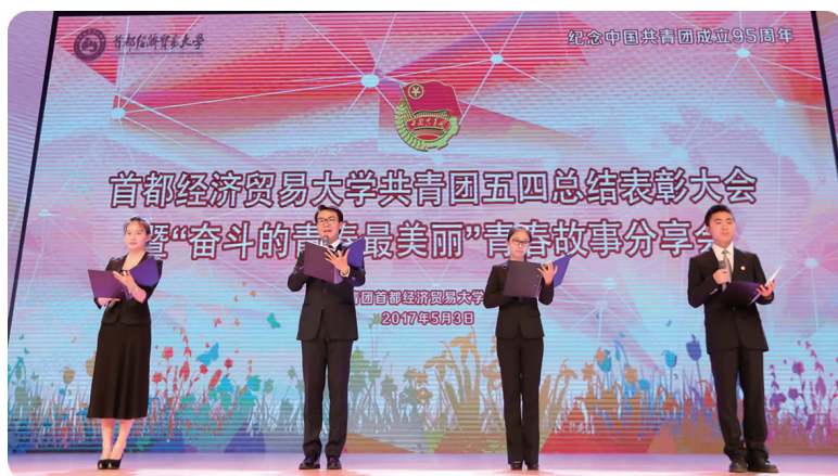
中图 5月3日,学校举行五四总结表彰会暨“奋斗的青春最美丽”青春故事分享会,图为诗朗诵《致青春》