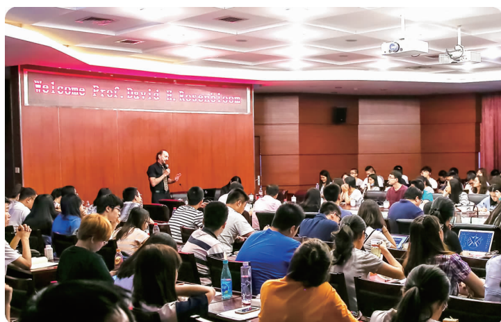
中图 6月15日,美国美利坚大学杰出教授、中国人民大学外专千人计划专家戴维·罗森布罗姆到校交流并主讲“美国公共管理的当前方向及问题”学术讲座