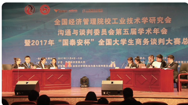
上图 11月4日,工商管理学院组建的学校代表队“首经贸商谈队”(左一至左四)获全国大学生商务谈判大赛总决赛冠军