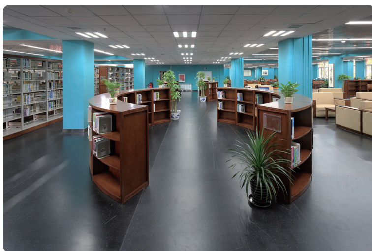
下图 5月2日,学校图书馆经过改建装修后重新开馆,图为图书馆内景