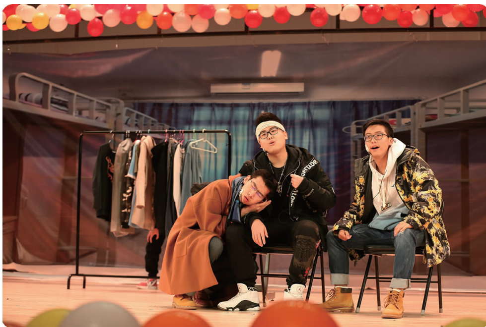
上图 11月30日,学校举行首届“欢乐经贸人”平安校园主题喜剧大赛,图为华侨学院侨我人生队表演《小偷?别跑!》